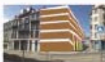
Vue avec immeuble