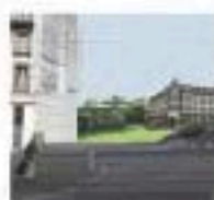
Vue avec Jardin

• Projet Trame verte : localisation d'emplacements susceptibles d'être végétalisés.