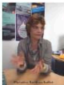
Responsable du service Patrimoines