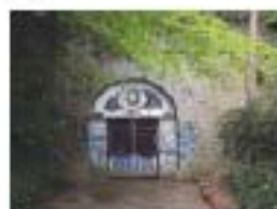
l'entrée du tunnel du chemin de fer départemental, rue Larrotte-Picquet