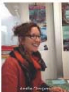
Chargée de projets du service Patrimoine